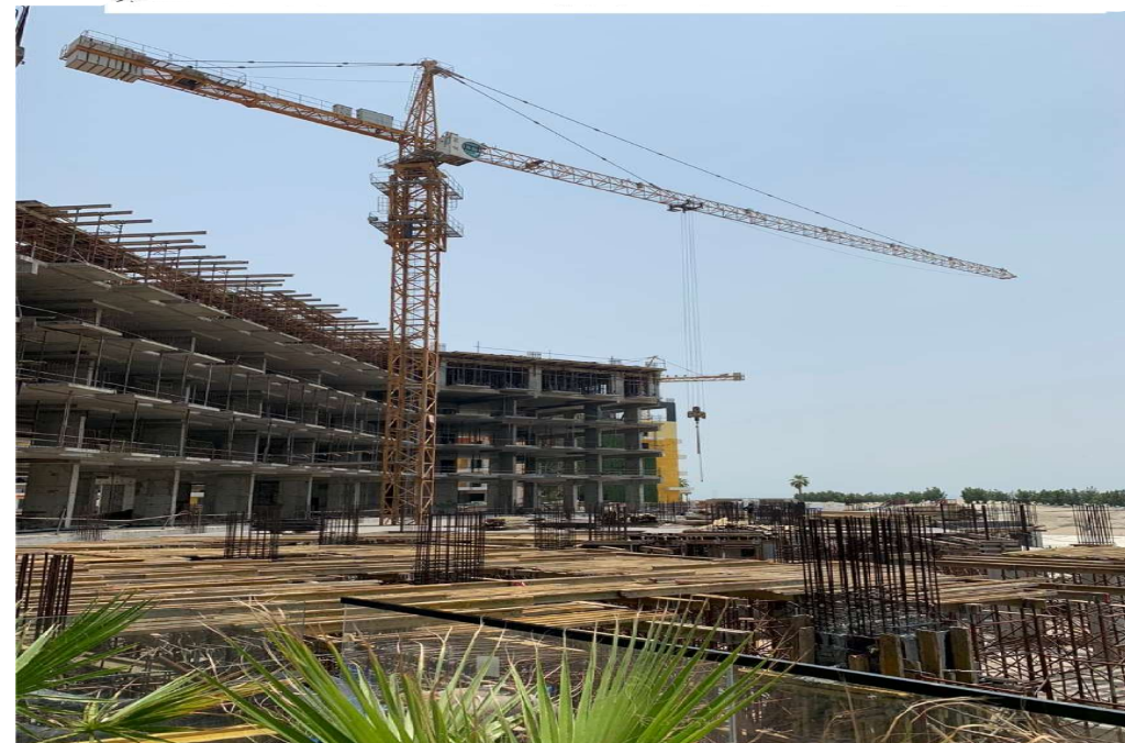
رافعة برجية موديل HTT 7015-10H حمولة قصوى 10 طن سنة الصنع 2018