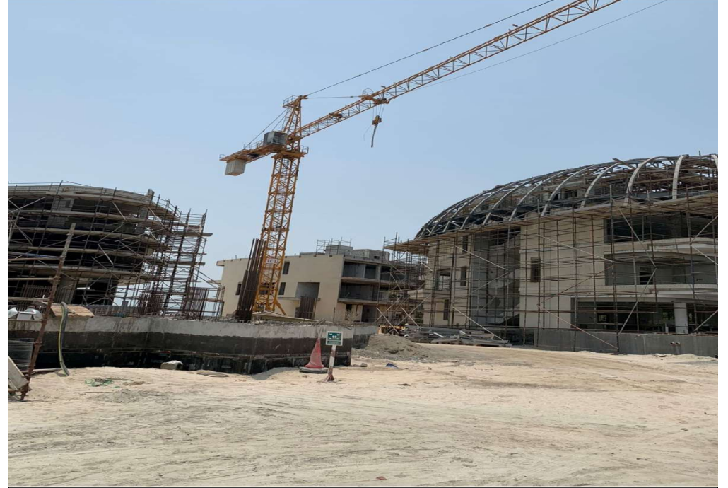
رافعة برجية موديل QTZ63-5013 حمولة قصوى 6 طن سنة الصنع 2008