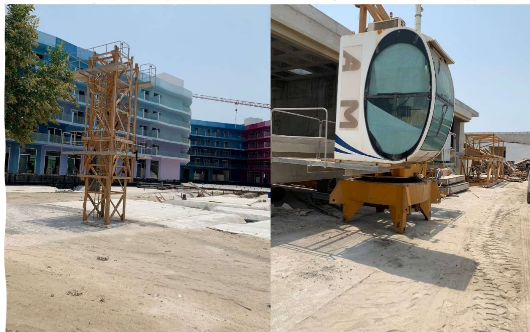
رافعة برجية موديل HTF 5510-6H حمولة قصوى 6 طن سنة الصنع 2018