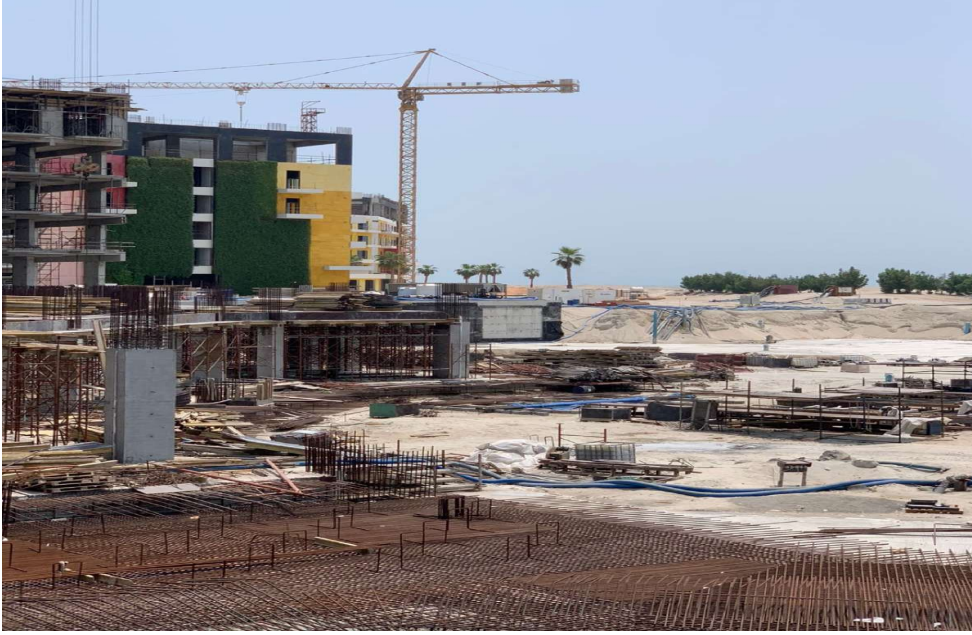
رافعة برجية موديل QTZ 250-7021 حمولة قصوى 12 طن سنة الصنع 2008