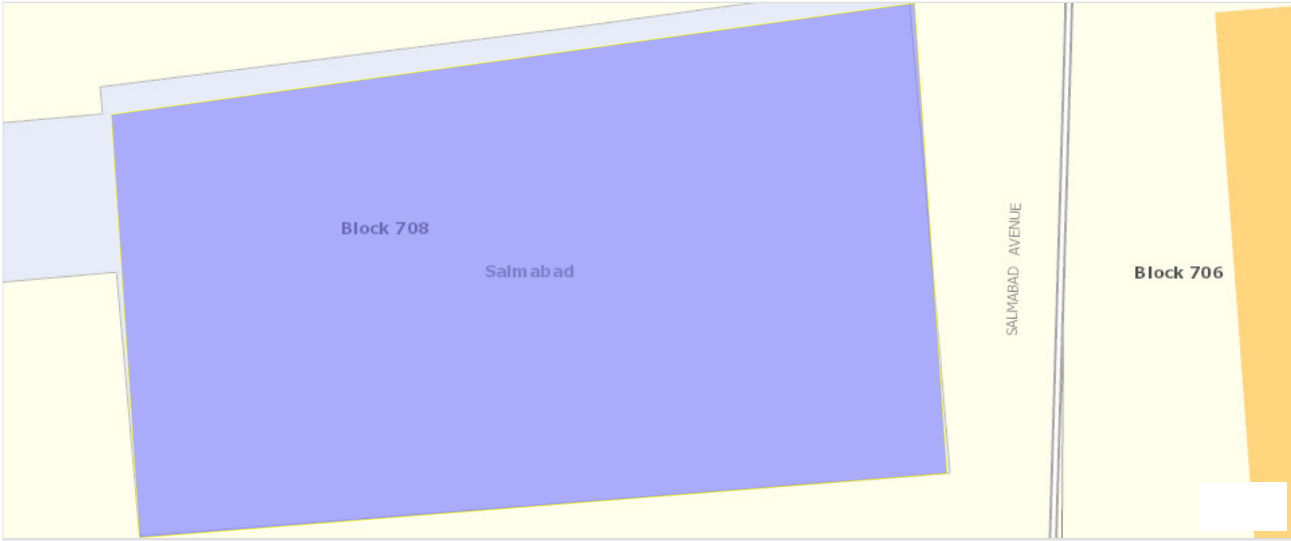
صورة الأقمار الصناعية

المجمع : 0708 المنطقة : سلما باد المحافظة : الشمالية