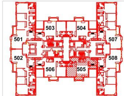
SCALE: N.T.S FLOOR: 5